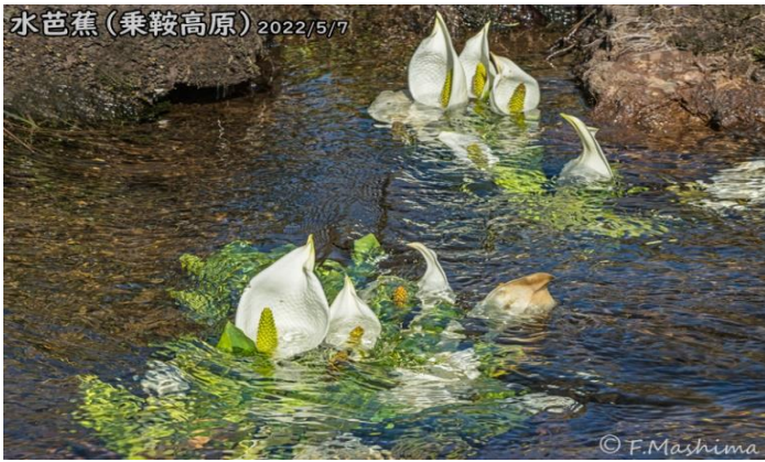
水芭蕉 (乗鞍高原) 2022/5/7