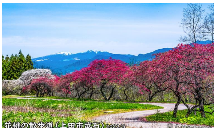
花桃の散歩道(上田市武石) 2022/5