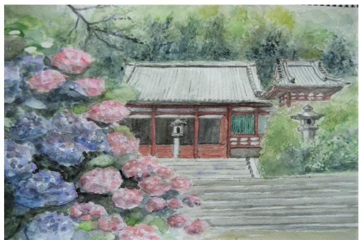
[ 奈良 : 矢田寺と紫陽花 ]