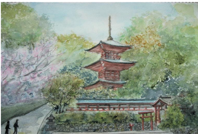
[ 神戸 : 須磨寺と桜 ]

[矢田寺] 大和郡山市矢田町の高野山真言宗の寺院で、山号は矢田山。正式名称を金剛山寺で別名「あじさい寺」と呼ばれています。