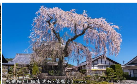
枝垂桜(上田市武石・信廣寺) 2022/4