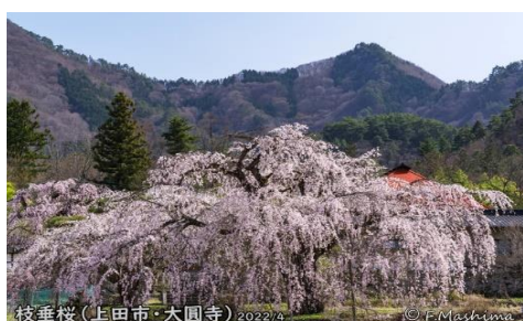
枝垂桜(上田市・大圓寺) 2022/4

自然豊かな信州にお住いの眞島さんからの季節ごとのフォト日より、今回は春の花がテーマの「春の花風景」編です。