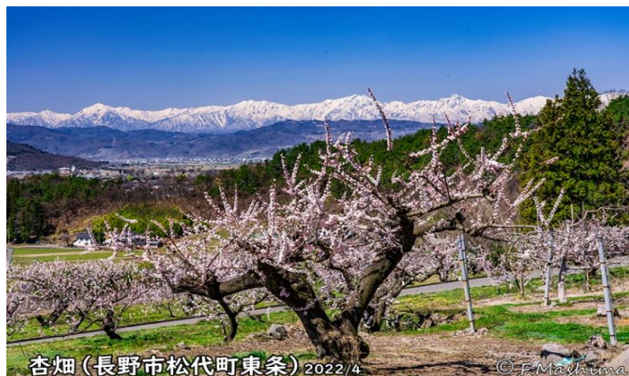
杏畑(長野市松代町東条) 2022/4