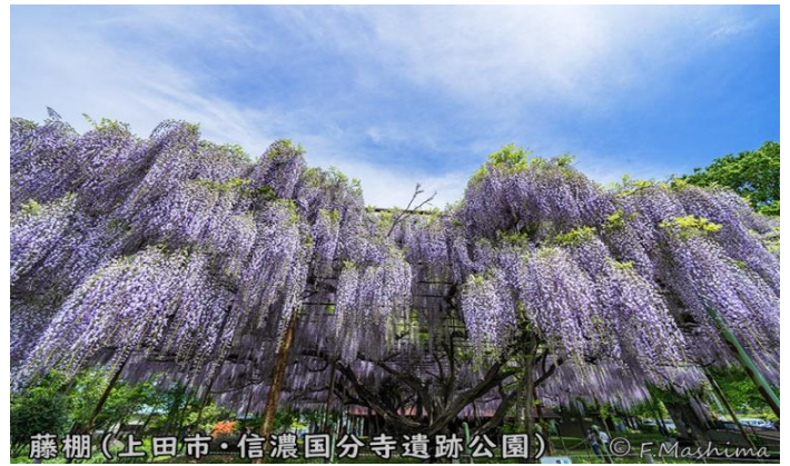
藤棚 (上田市・信濃国分寺遺跡公園)