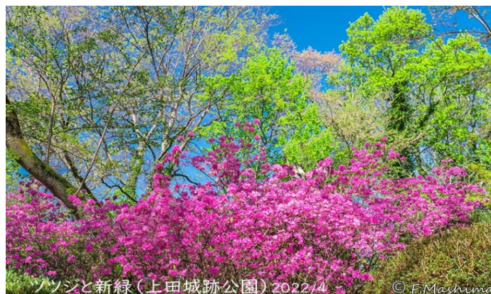
ハツジと新緑(上田城跡公園) 2022/4