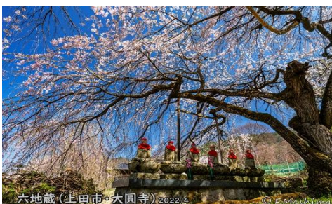
六地藏(上田市・大圓寺) 2022/4