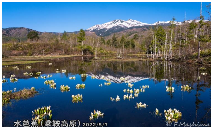
水芭蕉(乗鞍高原) 2022/5/7