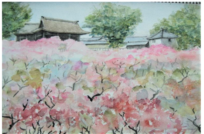
[ 大阪 : 道明寺と梅 ]

[須磨寺] 神戸市須磨区須磨寺町にある真言宗須磨寺派の大本山の寺院で、山号は上野山の正式名称は福祥寺だそうです。