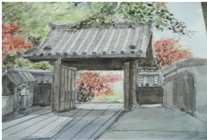
[ 京都 : 法輪寺と紅葉 ]

[道明寺] 藤井寺市に7世紀中に土師氏の氏寺にて建立された尼寺です。菅原道真公の伯母の覚寿尼が訪れたゆかりの地です。