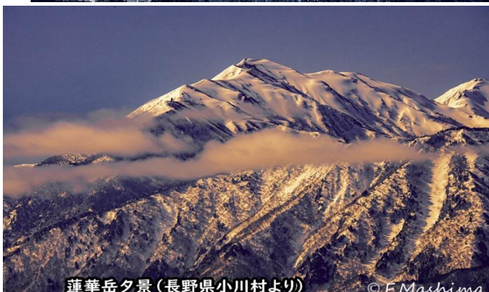
蓮華岳夕景(長野県小川村より)