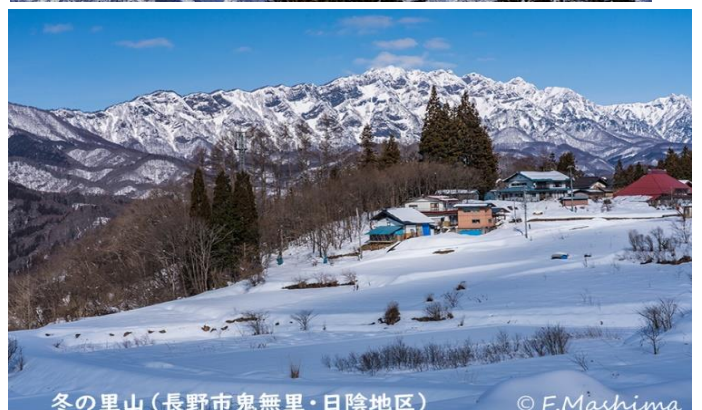
冬の里山(長野市鬼無里・日陰地区)