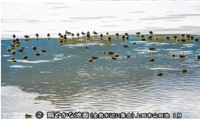
②賑やかな池面(全鳥水辺に集合)上田市山田池 1月