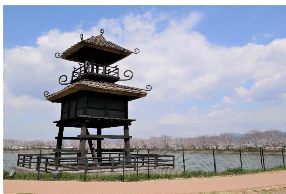
◇ 近隣①【唐古・鍵遺跡】

最後にご紹介したいのが、「結崎ネブカ」です。前述の能面と一緒に天から降ってきた一束の葱で戦前まで大和野菜の雄として栄えた甘くておいしい幻の葱です。しかし、柔らかさのためシャキッとしない見た目の悪さと市場流通に適さないなどの理由により次第に忘れ去られていきました。ところが一軒の農家がさかずき一杯の種を残してきました（私の知り合いの農家）。JAと共に協力し市場開拓を行ってきたところ、懐かしいふるさとの味が再評価され、伝統野菜として市場に復活することになりました。平成23年から販売を開始しましたが、当時はマスコミからの取材が後を絶たず、その農家のおじさんは、一躍時の人となっていました。現在は、17軒の農家が会員として生産していますが、柔らかいがゆえに傷みやすく、繊細な栽培を要求されています。一度、ご賞味ください。