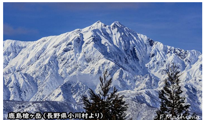
鹿島槍ヶ岳(長野県小川村より)