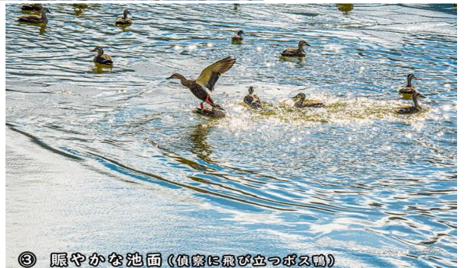
③賑やかな池面(偵察に飛び立つボス鴨)