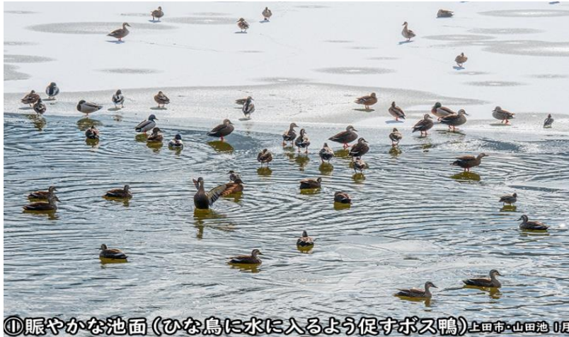
①賑やかな池面(ひな鳥に水に入るよう促すボス鴨)上田市・山田池 1月

①～③ 越冬のために飛来してきた賑やかな鴨の集団の写真です。氷点下の朝ですが、カメラを構えてじっと見ていると、雛たちに水泳ぎをさせようとしており、集団で子育てをしている様子がよくわかります。子供を虐待するニュースが多い今の人間社会には、渡り鳥たちの子育てに学ぶ点があるのではないのでしょうか。