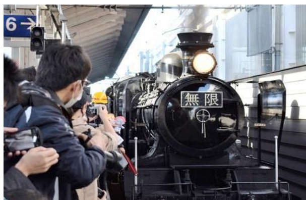
① JR九州イベント「SL人吉」 (Y.N記)