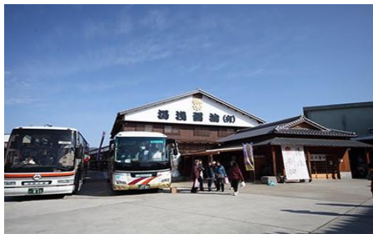
(醤油発祥の地「湯浅」)