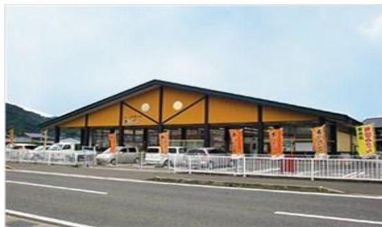
(JA ありだ直売所「ありだっこ」)