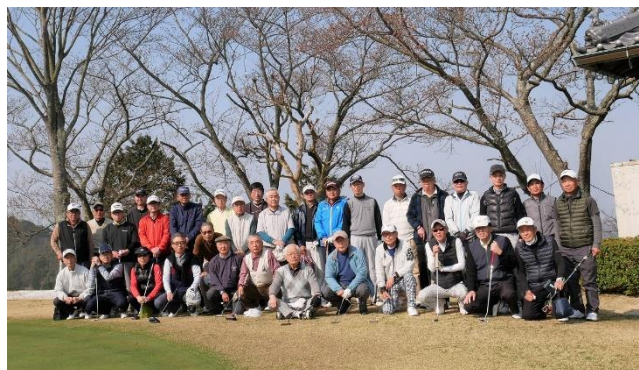
(晴天の下、参加された皆さん)