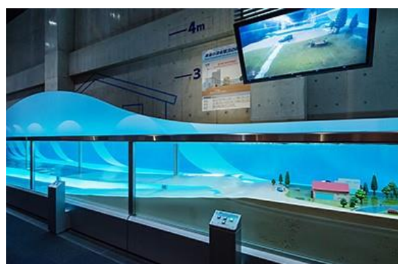
(津波教育防災センター)