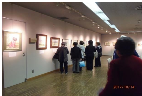
(昨年開催の第 15 回教室展)