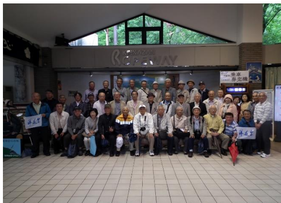
(写真は楽しかった「春のバス旅行」)

30周年記念バス旅行第2弾を現在企画中です。5月に開催しました第1弾の「春のバス旅行」(岐阜のシンボル「岐阜城の観光」)は、満席の参加者(41名)で楽しい一日を過ごすことが出来ました。初めて参加された会員の方からは、「大変楽しかった、また参加させていただきます」との感想をいただきました。毎回バス旅行は、参加者を確保することに腐心し、担当者を中心にいろいろな企画を検討してきましたが、30年を迎える「春のバス旅行」は事前 PR も含め早くからの準備が奏功し大成功を収めました。