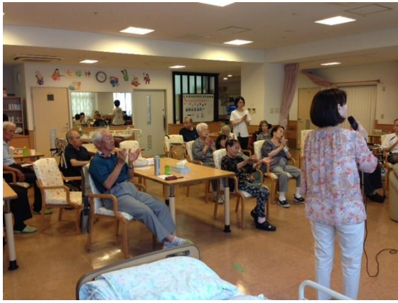
(手拍子で大いに盛り上がる)