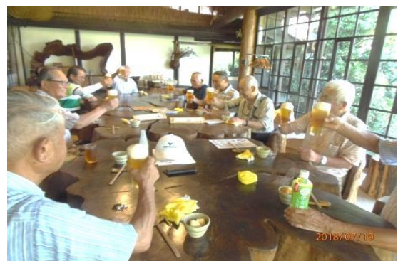
(昼食懇親会:「杉の五兵衛」にて)