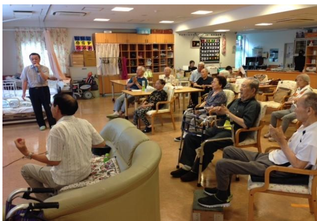
(手拍子、かけ声、絶好調！)

今回の慰問(7月28日)は、初めてでもあり様子も何も分からないという手探り状態でしたが、臨機応変(行き当たりばったり)に進めた結果、案ずるより産むがやすしで、参加者とのハイタッチあり、盆踊りあり、投げキッスありの大盛況となりました。参加された方には、大いに喜んでいただきました。第2部では、各テーブルに分かれて懇話会形式で参加者との懇親を深めました。各テーブルとも参加者の明るさが功を奏して各テーブルとも世間話、ご家族の話、カラオケの話など大いに盛り上がりました。