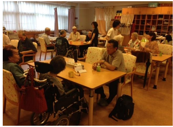
(第2部懇話会で世間話に話し合が弾む)

洋友会大東地区クラブ活動での慰問活動は初めてですが、今後も社会貢献活動の一つとして老人ホームの慰問は続けていきたいと思ひます。次回は、8月28日(火)に予定しておりますが、今回の訪問結果を踏まえより参加者の心の和、人生の生きがい作りにご協力をしていきたいと思ひます。