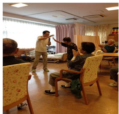
(92歳の入所者とハイタッチ)