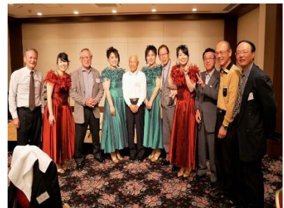
退任される水原前相談役 を囲んで