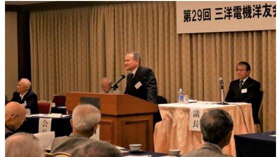
三宝前会長のご挨拶