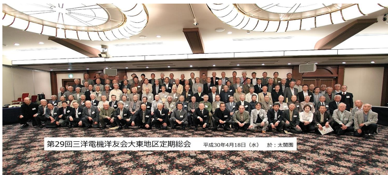
第29回三洋電機洋友会大東地区定期総会 平成30年4月18日(水) 於:太閤園

4月18日(水)洋友会大東地区定期総会及び懇親会が、出席者122名で太閤園ゴールデンホールにて開催されました。今総会は、洋友会設立30周年を記念し会場を今までの大東事業所構内から外部の太閤園(京橋)で開催されました。懇親会も30周年に相応しい内容でコーラスグループの「サンタ・マリア」によるミニコンサートも取り入れ盛大に行われました。