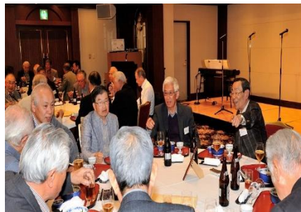
楽しい会話が弾む 懇談風景