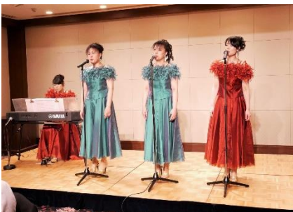
30周年に相応しい サンタ・マリアのミニコンサート