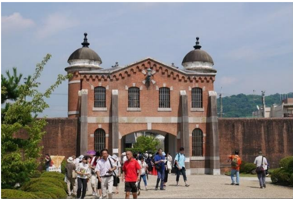
(立派な煉瓦造りの表門)