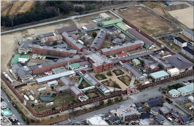
(旧奈良監獄の航空写真)