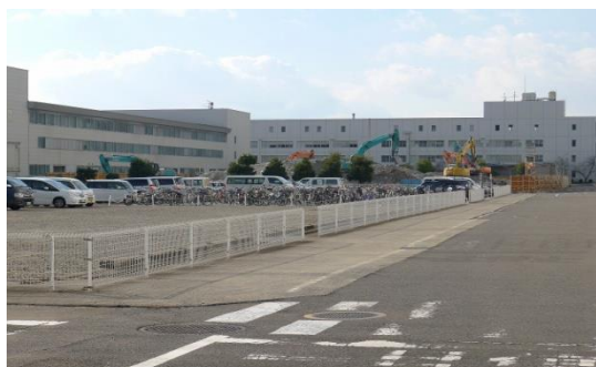
解体完了後の 403,404 号棟