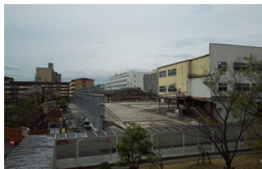
解体中の 202,204 号棟