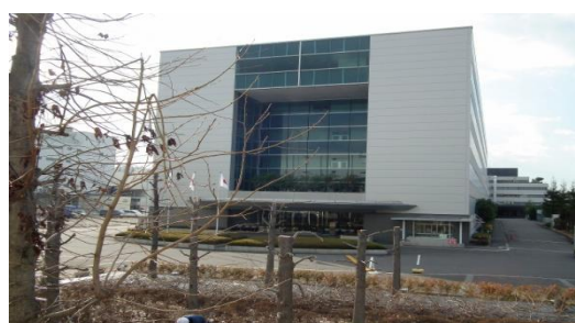
京セラ入居の 305 号棟