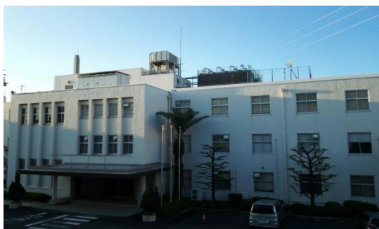
解体前の 102 号棟

三洋電機がパナソニックに統合された後、営業拠点・製造拠点が大きく変動しております。機関誌「洋友」では、各地の製造拠点についての現況を各地区からの報告として順次掲載をしておりますが、大東事業所も古い建屋については解体が進められ大きく変貌しております。地区だより今月号において大東事業所が“今”どうなっているのかを写真でご紹介します。